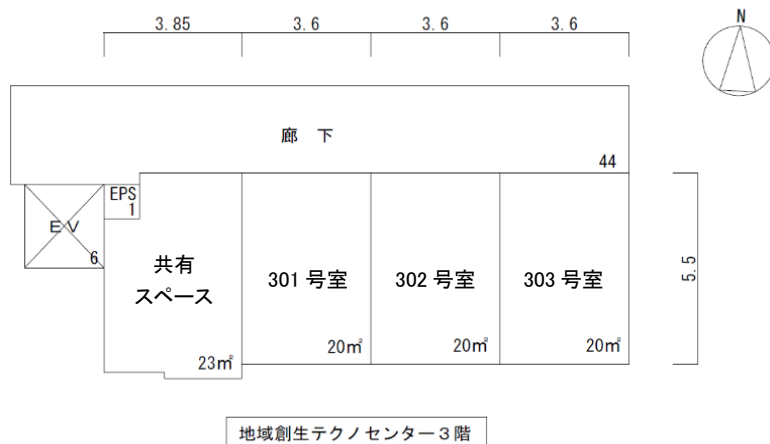
未来創造ラボラトリー平面図